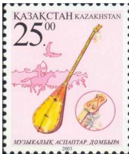
Почта маркасындағы домбыра

XIX ғасырда қазақ халқының тұрмысында анағұрлым кең тараған Музыкалық аспап екі ішекті домбыра болатын. Егер бұрынғы заманда көне аспаптар ән, жыр, ертегі-аңыздарды сүйемелдеу үшін ғана қолданылған болса, енді домбыра жеке шығарма орындауға арналып, күрделі аспаптардың қатарына қосылды.